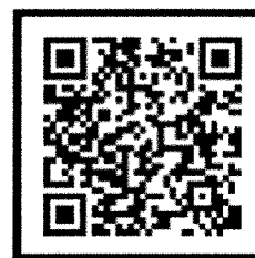
【登録用バーコード】